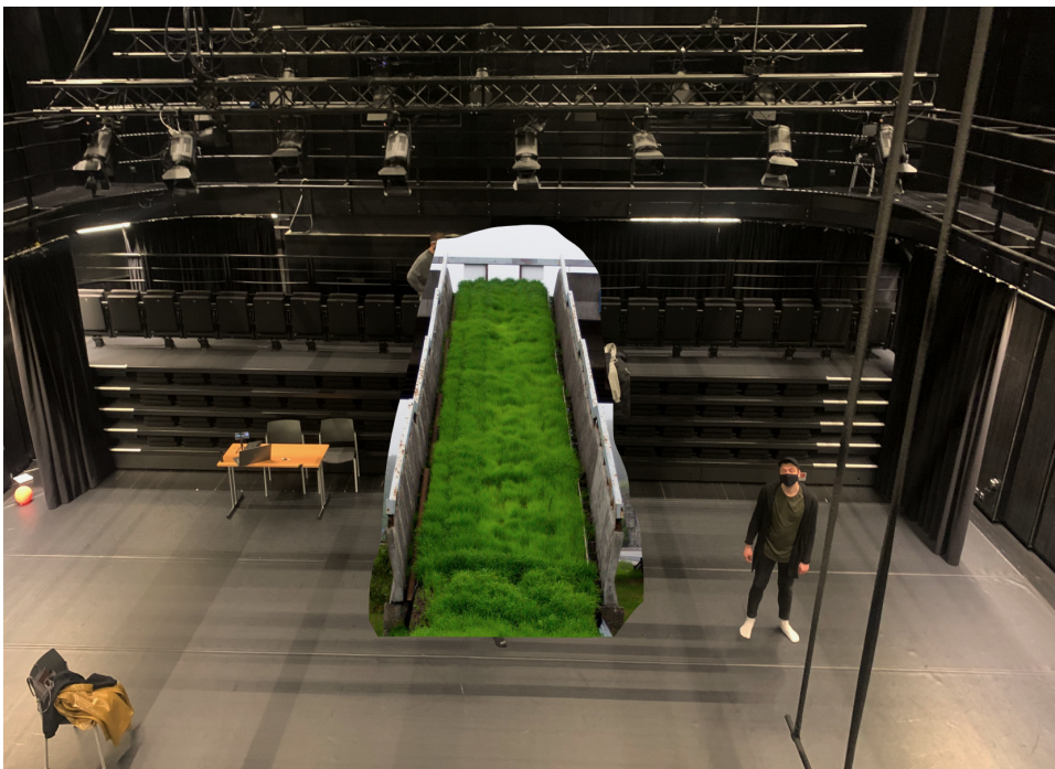
Joonis 7. Muru illustratsioon

Üheks ideeks oli lavastuses kasutada päris muru. Soov oli luua idülliline keskkond, kus nii etendaja kui ka vaataja saaksid võimalikult autentse atmosfääri kevadisest õhkkonnast. Näitleja pidi lavale tooma mururullid, need siis lahti rullima ning sellele pikali heitma. Lähtudes siinse uurimuse analüüsist, oleks päris muru eeliseks olnud lõhn ning autentsus, eriti võrreldes kunstmuruga, mis sellist tunnet ei võimalda. Kahjuks pidime ideest loobuma ning asemele tehti eelnevalt mainitud jaapani aed.