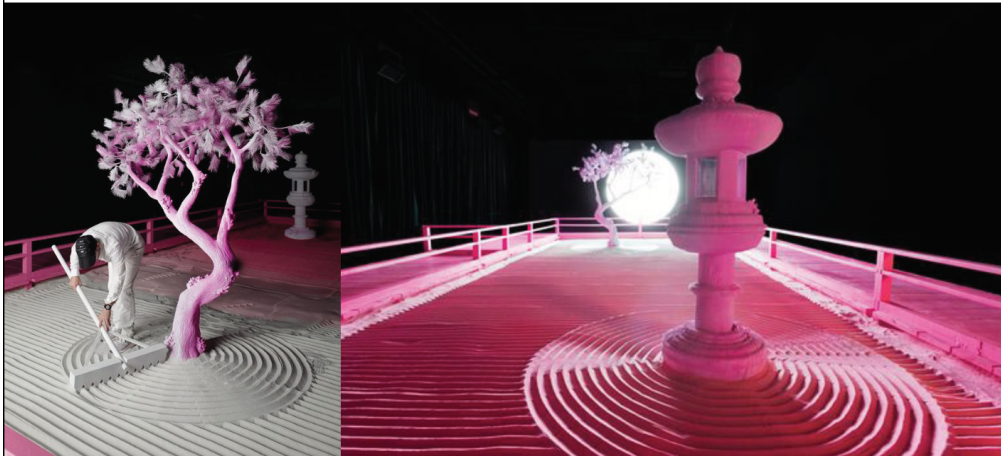
Joonis 4. Jaapani aia illustratsioon.